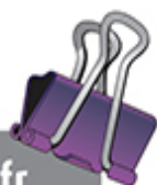
Photo : Antenne Toiture/Ile-de-France